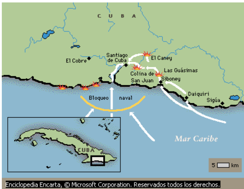
Enciclopedia Encarta, © Microsoft Corporation. Reservados todos los derechos.